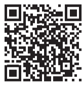
問責決議全文 (区議会HP)

また、今回も議場で党区議団に対して「ポチっころになった共産党」、「ポチ」と侮辱発言を繰り返しました。党区議団は抗議文を送付し、猛省と謝罪、再発防止を求めています。