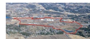
茨城中央工業団地