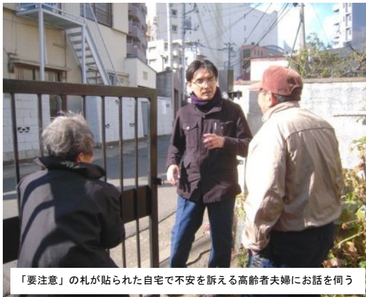
「要注意」の札が貼られた自宅で不安を訴える高齢者夫婦にお話を伺う