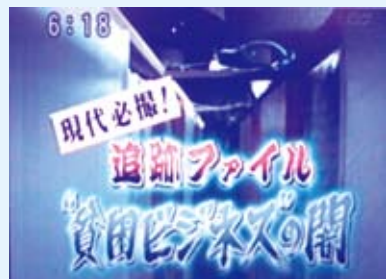
▲スーパーニュース(7月28日フジテレビ)

フジテレビは七月二十八日のニュース番組で、住む家のない生活保護受給者の宿泊所「あけぼの園」(水戸市泉町)を、生活保護費をピンハネする「貧困ビジネスの典型」と報道。水戸市は二年半でホームレスなど六十三人を「あけぼの園」に紹介しています。