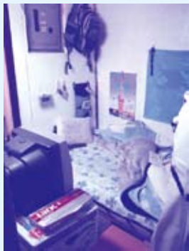
▲一人二畳のスペース(あけぼの園)

フジテレビは七月二十八日のニュース番組で、住む家のない生活保護受給者の宿泊所「あけぼの園」(水戸市泉町)を、生活保護費をピンハネする「貧困ビジネスの典型」と報道。水戸市は二年半でホームレスなど六十三人を「あけぼの園」に紹介しています。