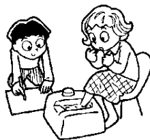
骨密度チェック 血管年齢チェック してみませんか？