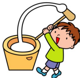
つきたておもち (売り切れ御免)