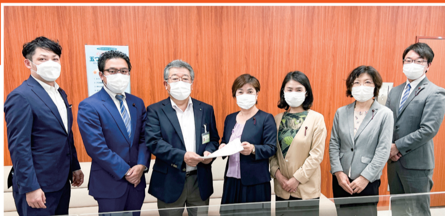
給食費値上げ撤回の申し入れ (2022年5月6日)

共産党区議団は、5月6日、給食費値上げを撤回するよう要望書を提出。一般質問で、他区が公費投入で保護者負担を抑えていることを示し、国の交付金も活用し給食費軽減の検討を要求。区は「交付金の活用も視野に」「方策を検討してゆく」と答弁しました。