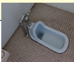
区内小学校のトイレ