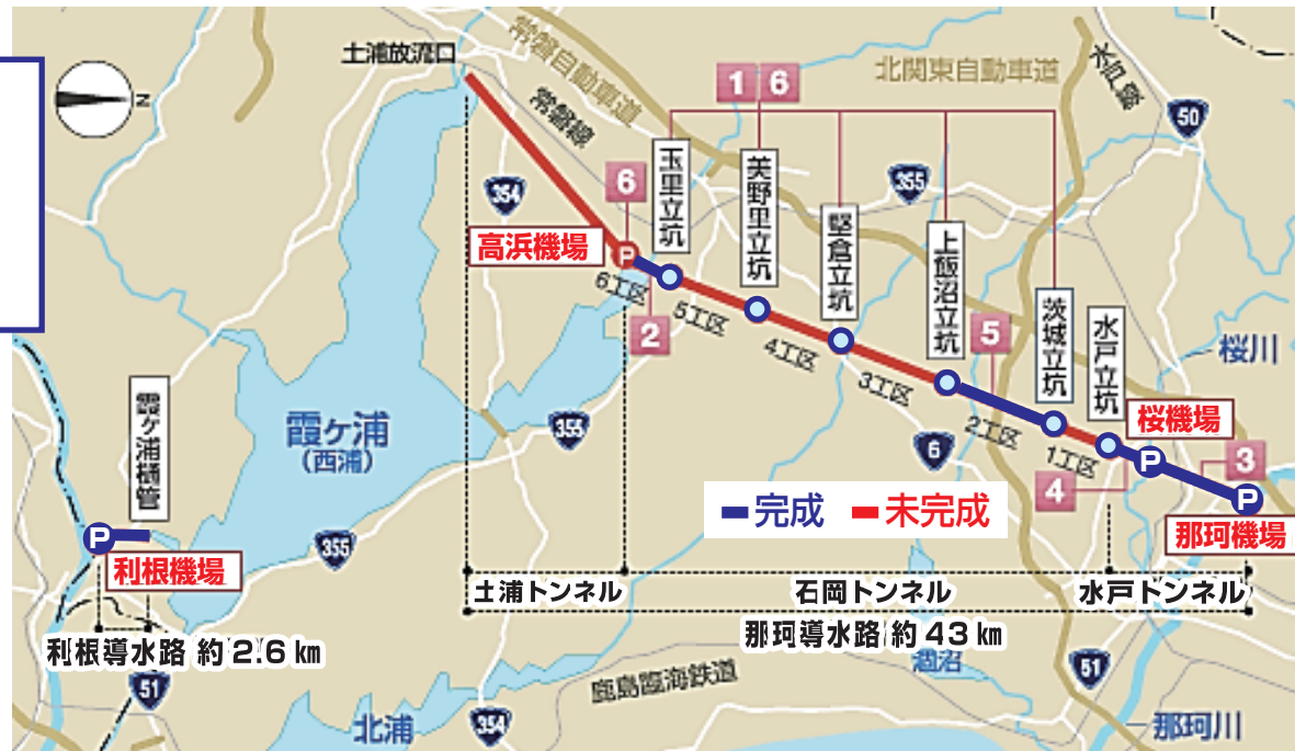
国土交通省関東地方整備局霞ヶ浦導水工事事務所HPより作成