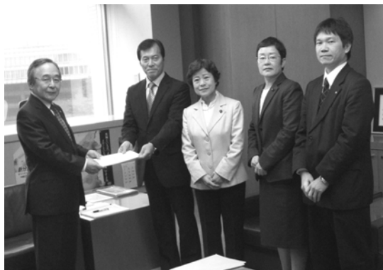
川侯副知事(左)に要望書を手渡す山中県議ら(11月30日)

日本共産党茨城県委員会と同県議団は11月30日、新年度県予算の要望書を提出しました。雇用、暮らし、中小企業、子育て支援、大型開発の見直しなど282項目におよびます。