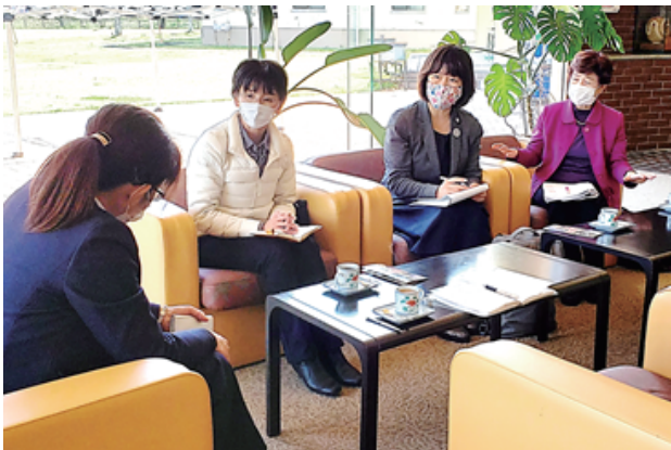
休業中のホテル関係者から要望を聞き取る江尻県議ら（4月14日）