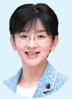
江尻 かな 県議会議員

休校中の児童生徒の自宅学習を支援するために、学校と教育委員会は子どもの声をよく聞いて取組をすすめる必要があります。教育格差や児童虐待、DV（配偶者暴力）をくい止める対策を重視します。あなたのご意見、ご要望をお寄せください。