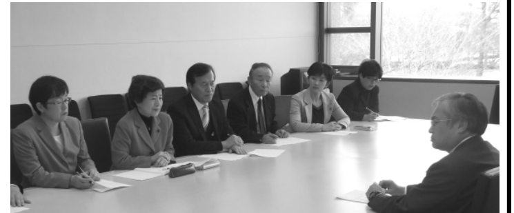
大内・鈴木両県議らは日本原電が東海第2原発の再稼働に向けた適合審査の申請を急いでいることから、知事にたいし原電に申請はしないよう申し入れることを要請しました(2月13日)